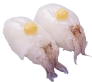
『姿やりいか』 二貫 110円（税込）