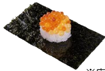
『2種いくら合盛り包み』 一貫 110円（税込） （いくら・つきみいくら）