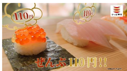
(NA 下野さん) ぜんぶ 110円！