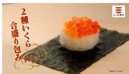
(NA 下野さん) いくらも、