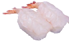
『生えび』 二貫 200円（税込）