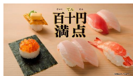
(NA 下野さん) ひゃくてん！満点祭り！