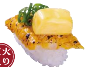
『炙りコーンバターにぎり』 一貫 110円（税込）