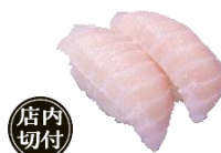
『びんちょうハラモ』 二貫 110円（税込）