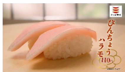
(NA 下野さん) びんちょうも、