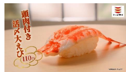
(NA 下野さん) 大海老も…、