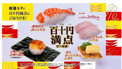
(NA 下野さん) 祭り開催！