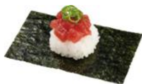
『本鮪上赤身ぶつ切り包み』 一貫 110円（税込）

【かっぱの本鮪祭り】 販売期間：2022年12月14日（水）～12月26日（月）予定