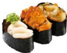
『冬の旨ネタ三昧』 三貫 242円（税込）

【かっぱの冬！ごちネタ】 販売期間：2022年12月14日（水）～2023年1月9日（月・祝）予定