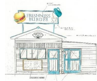
当時の創業者直筆の設計図

最寄の駅から徒歩15分。その場所で創業者が店舗にしようと思った物件は、劇団の稽古場として使われていた木造の一戸建て。不動産屋からは「何をやってでも商売にならなかった」と言われたほど、人通りの少ない場所にたたずんでいました。