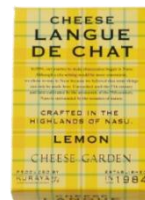
レモンチーズラングドシャ 5枚入 900円(税込)