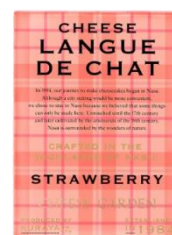
ストロベリーチーズラングドシャ 5 枚入 900 円(税込)