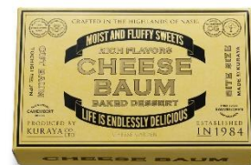
チーズバウム 1,680 円(税込)

機械だけに頼らずに、職人の目と手によって焼き上げられる、濃厚なチーズの香りと、しっとりとした美味しさがお楽しみいただけます。