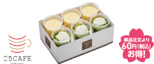
『プレミアムスイーツ BOX』 6個入り お持ち帰り価格 2,280円（税込）