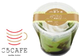
日本橋榮太樓 監修 『黒みつを味わう プレミアム宇治抹茶プリン』 お持ち帰り価格 390円（税込）