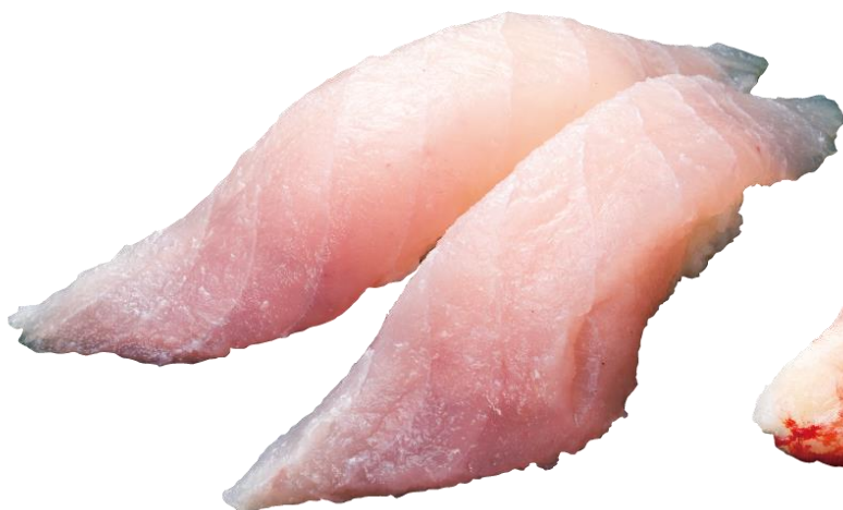
●大きいびんちょうまぐろ 308円