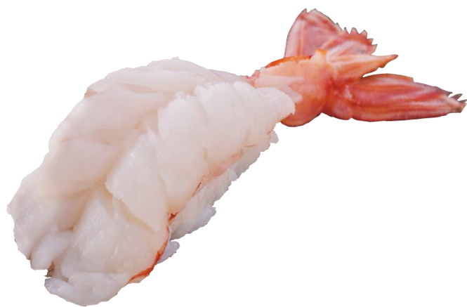
●大きい赤えび 一貫253円/二貫451円