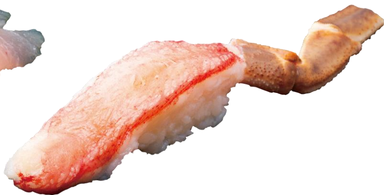
●大きい生ずわい蟹一貫 748円