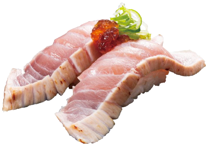
●大きいまぐろハラモたたき ～柚子ポン酢ジュレ～ 363円