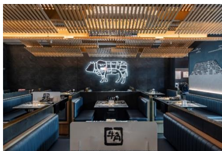
UAE「牛角」1号店イメージ（写真左:インドネシア、同右は中国内の店舗）