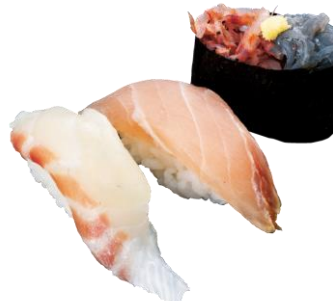
●春三昧第一弾 (アセロラ真鯛/かじき/生しらす生桜えび合盛り軍艦) 590円