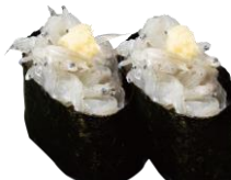
●広島県産 生しらす軍艦 340円