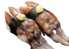
●兵庫県産 生ほたるいか 340円