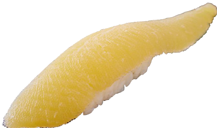
●特大数の子一貫（北海道産） 390円