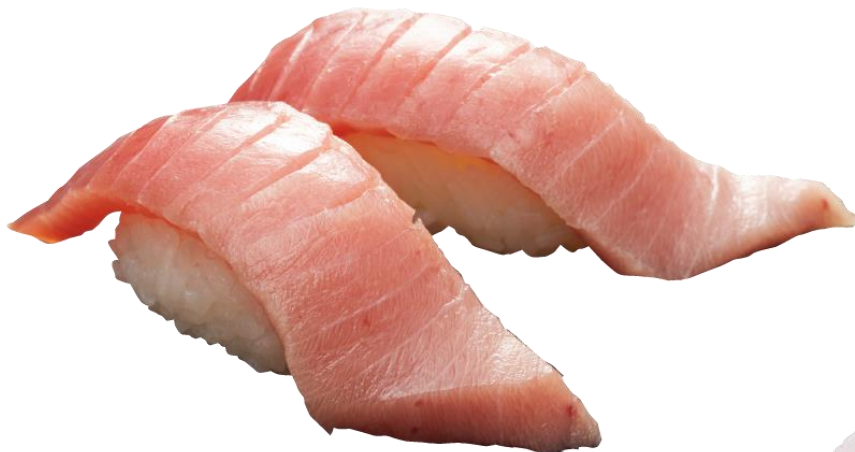
●みなみまぐろ中とろ 440円