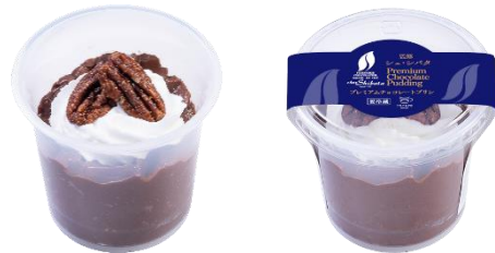
プレミアムチョコレートプリン お持ち帰り価格 320円（税込）