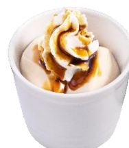
桔梗信玄餅風きな粉ホイッププリン ～特製黒蜜がけ～ 297円（税込）