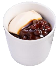
桔梗信玄餅風きな粉プリン ～特製黒蜜がけ～ 297円（税込）

山梨県の老舗和菓子屋「桔梗屋」オリジナルのきな粉を使用し豆乳ベースで仕立てた、滑らかな口当たりと弾力のある食感が楽しめるプリンです。北海道産小豆を使用した、程よい甘みのゆであずきと、「桔梗屋」特製のとろみある黒蜜をトッピングしました。きな粉の豊かな風味と濃厚でコクのある黒蜜の味わいが楽しめます。