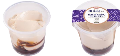
桔梗信玄餅風きな粉プリン～特製黒蜜使用～ お持ち帰り価格 320円（税込）