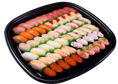
5人前 (60 貫) 6,200 円 (税込)