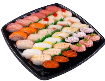
3人前 (36 貫) 3,720 円 (税込)

長寿の象徴として知られる『えび』を 2 種類（「生えび」「えび」）揃え、人気ネタの「まぐろ」「中とろ」「サーモン」や、ちょっと贅沢な盛り具合の「特盛いくら」「特盛ねぎとろ」などを詰め合わせました。かっぱ寿司と言えば定番の「サラダ軍艦」なども入った、敬老の日やさまざまな行事などを迎える秋の食卓にぴったりのセットです。