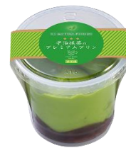
『宇治抹茶のプレミアムプリン』 お持ち帰り価格 320 円 (税込)

※1 日の販売予定数が無くなり次第終了です。 ※一部店舗において取り扱いがない場合がございます。 ※掲載写真はイメージです。