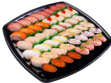
4人前 (48 貫) 4,960 円 (税込)