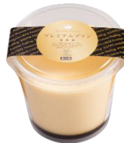
『プレミアムプリン』 お持ち帰り価格 320 円 (税込)

おこさまから大人まで幅広くご支持いただく人気商品『プレミアムプリン』、2023 年 5 月より登場した『宇治抹茶のプレミアムプリン』の 2 種類をお持ち帰りスイーツとして販売中です。ご自宅でのスイーツタイムや、ちょっとした手土産、ギフトにぴったりです。