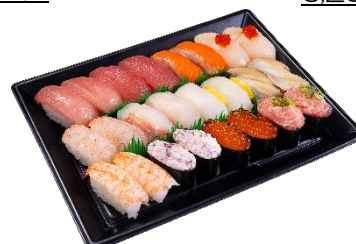
2人前 (24 貫) 2,480 円 (税込)