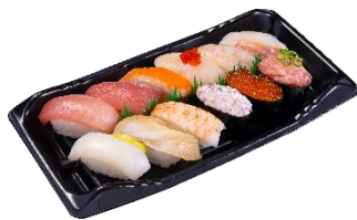
1人前 (12 貫) 1,240 円 (税込)