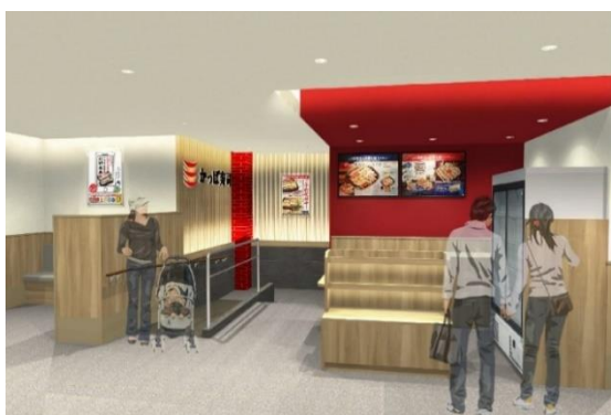
店舗ファサード（イメージ）

大阪のグルメやショッピング、アミューズメントなどが集まる人気の「道頓堀」は、2025年開催予定の「大阪・関西万博」や2031年春の開業を目指す「なにわ筋線」の計画などにより、今後も更なる魅力向上・発展が期待されているエリアです。その中でかっぱ寿司 道頓堀戎橋店は、ファミリーや友人同士、国内外の観光客の利用まで幅広いニーズにこたえる店舗をめざします。