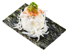
釜揚げ桜えびと しらすの紅白包み