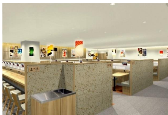
店舗内観（イメージ）

かっぱ寿司では、最近ますます「うまいらしい！」と喜んでいただける商品、お楽しみいただけるお店作りにもこれからも注力してまいります。