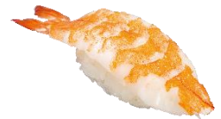
活め頭肉つき大えび