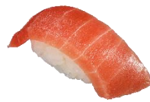
天然まぐろ中とろ