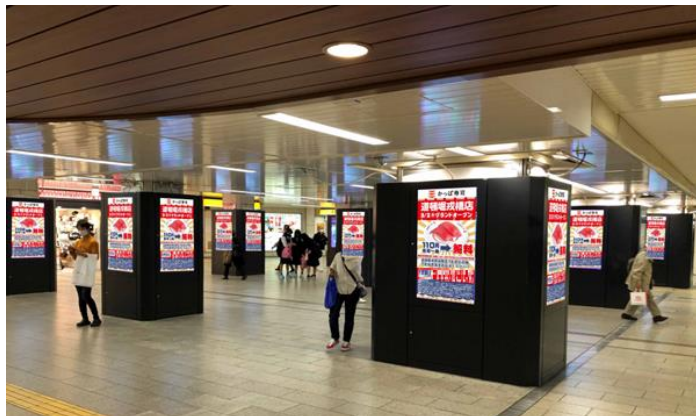
デジタルサイネージイメージ