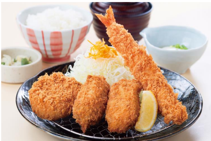
【イートイン】牡蠣ミックス定食