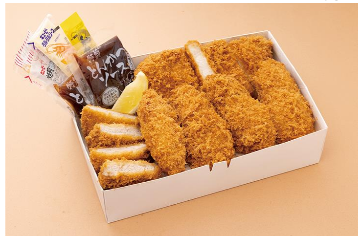
【テイクアウト】牡蠣入ボックス