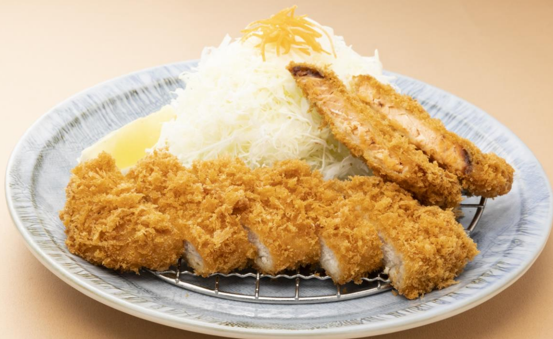
ルスツ羊蹄（ようてい）ぶたプレミアムとんかつ&サーモンクリームチーズフライ定食