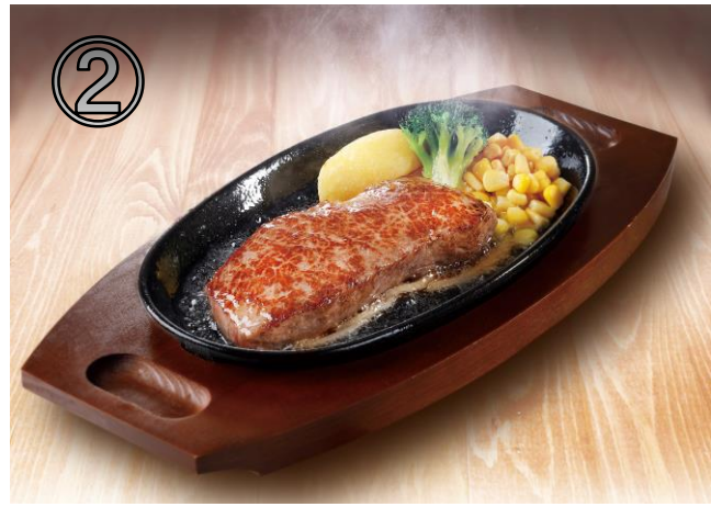
①てっぱんステーキ（創業の味 牛のサガリ）・②宮ロース