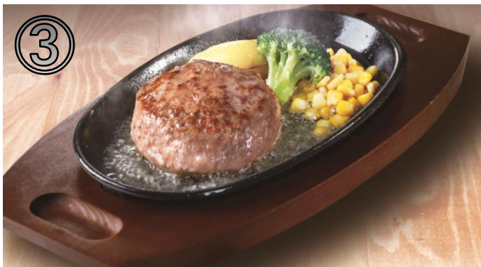
③宮ハンバーグ（牛肉100%） ランチタイム：ライスバーorパン+スूपバー付 225g 1,090円 ディナータイム：単品 225g 1,089円

ディナータイム：単品 90g 1,089円/140g 1,639円 180g 2,079円/240g 2,739円