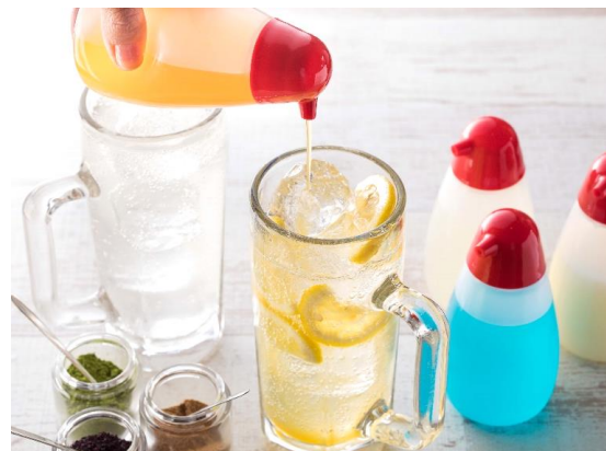
オリハイ：サワー/水割り酎/バイボール 各399円(税込)