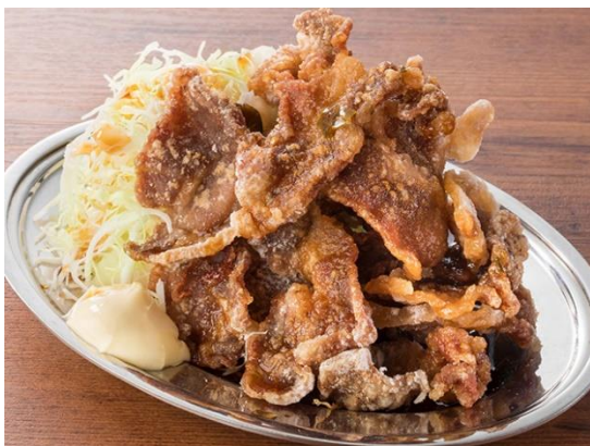
必喰・名物ぶたから 690円(税込)

また、ドリンクメニューのひとつ「オリハイ」は、ベースのお酒に、お好みでレモンやカルピスなどのシロップや抹茶粉などのフレーバーを混ぜて自分好みのオリジナルのお酒づくりを楽しんでいただけます。