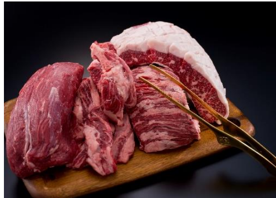
2等 ギガ肉厚牛角盛り