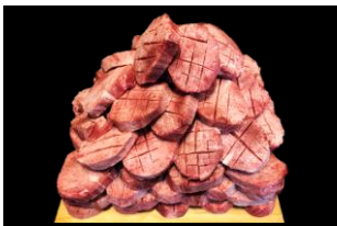
3等 霜降り上タン塩