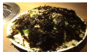
カルビ専用ごはん