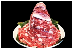
4等 黒毛和牛カルビ タレ