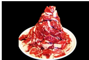
5等 上ハラミ タレ