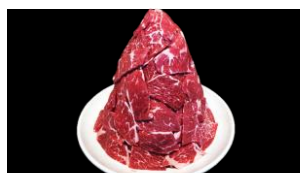
8等 ロース タレ