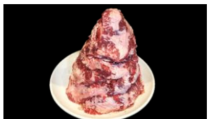
7等 カルビステーキ