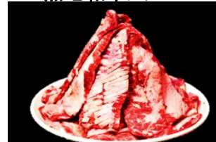
上カルビステーキ