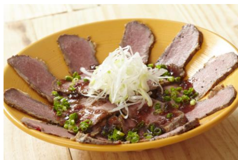
「魅惑のローストビーフ丼」890 円 カルビのローストビーフがあなたを魅了する