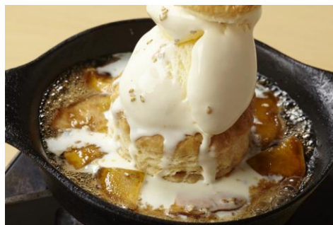
「安納芋のホットメープルパイ」590 円 ほくほくの安納芋は、溶けたバニラアイスソースにしてどうぞ♪