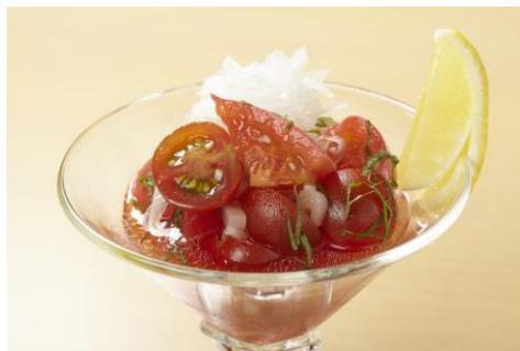
「トマト・とまと・TOMATO」490 円 上から食べても下から食べてもトマト