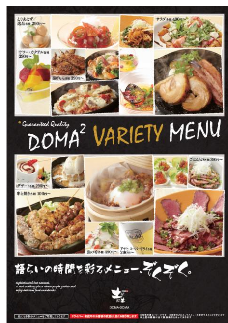
【グランドメニューポスターイメージ】