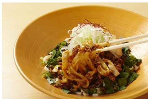
「旨辛 坦々まぜ麺」690 円 混ぜて味わう旨辛の極み