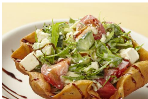
「トルティーヤ器の和カモレサラダ」690 円 サラダとしても食事としてもボリュームたっぷり！