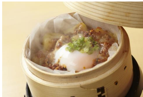
「きたあかりの肉味噌チー玉蒸し」490 円 ほくほくでピリ辛をお楽しみください