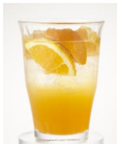
「生オレンジサワー」390 円 生のフルーツたっぷり、生フルーツサワー