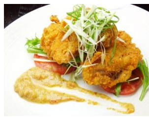
【フライドチキン トマトヴィネグレット】 750円(税抜)