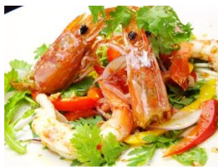
【赤海老のアジアンスタイル】 750円(税抜)