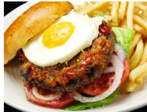
【ジャックダニエル BBQバーガー】 1,600円(税抜)