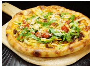
【メキシカンタコスピザ】 1,500円(税抜)