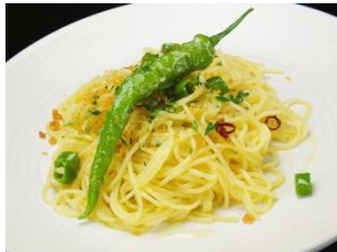
【伏見唐辛子の ペペロンチーノ】 1,100円(税抜)