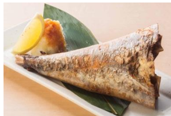
【まぐろ釣鐘焼き】 680円（税抜）