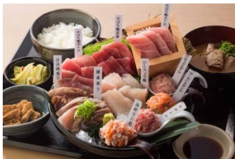
【名物大漁定食】 2,980円（税抜）