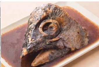
【豪快！まぐろカブト煮付け】 880円（税抜）