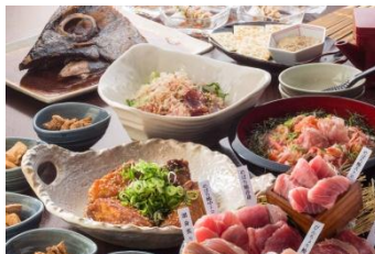
【まぐろ三味宴会コース】 4,000円（税抜）