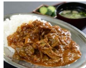
やきとん屋のハヤシライス 680円（税込）（ライスお替り無料）