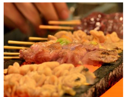
※ぎんぶた商品イメージ