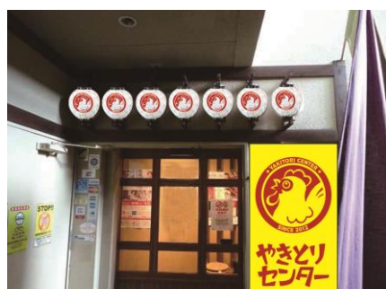
※やきとりセンター外観パース