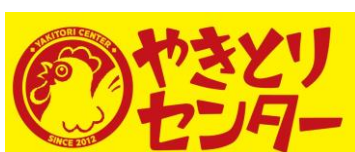
※やきとりセンターロゴ