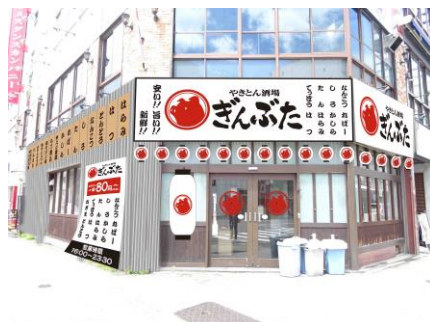
※ぎんぶた外観パース