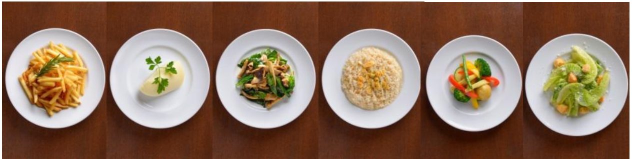
フレンチフライ マッシュポテト 納豆の草とキノコ炒め ガーリックラス スチームベジタブル シーザーサラダ