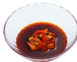
『シビ辛ソース レベル2 ～海鮮入り～』 100円（+税）