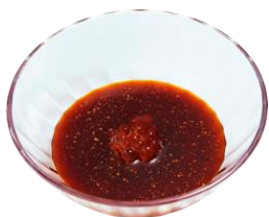
『シビ辛ソース レベル3 ～いくら入り～』 100円（+税）