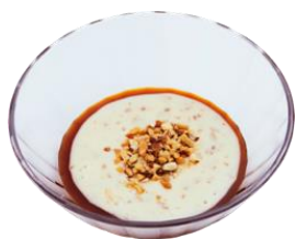
『シビ辛ソース レベル1 ～ナッツソース入り～』 100円（+税）