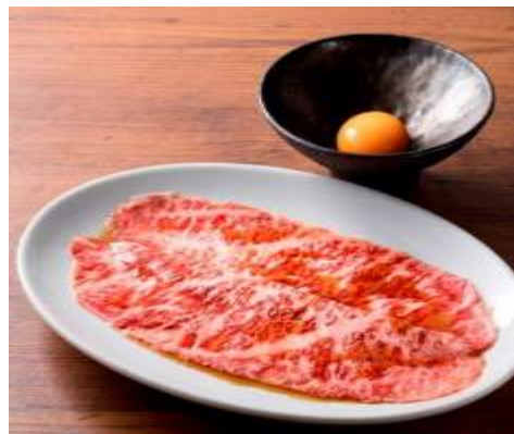
ザブトンのすき焼き 2,000円(税抜) 薄切りのザブトンをサッと炙って 濃厚な黄身の滋養卵で召し上がって頂きます。