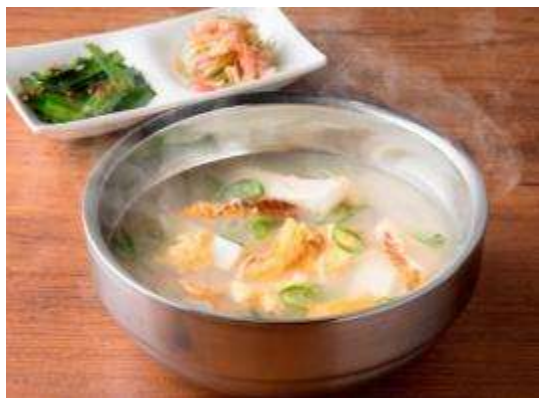
名物！干しダラのスープ 800円(税抜) 韓国発祥のUSHIDOKIオリジナルスープ。 酔いさましに良いカラダにうれしいスープです。