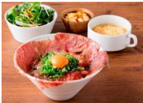
数量限定！A5ザブトンの炙り肉刺し丼 1,680円(税抜) 入荷次第の限定商品。 口の中でとろける最上級和牛をランチでお得に。