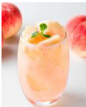
旬の国産フルーツのサワー 800円(税抜) * 8月は国産白桃のフレッシュサワー

“旬の国産フルーツのみ”にこだわった季節のサワーや、“国産レモンのみ”にこだわったレモンサワー、そしてこだわりの茶葉を使ったお茶ハイを中心に、ワイン等も上質な商品を取り揃えています。