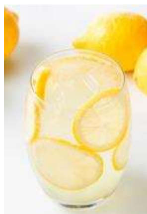
国産レモンの生レモンサワー 650円(税抜) * 国産のレモンをまるまる1個分使用