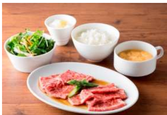
USHIDOKIセット 1,580円(税抜) カルビとロースを盛り合わせた焼肉セット USHIDOKI特製の熟成醤油ダレで食べる 王道ランチ。