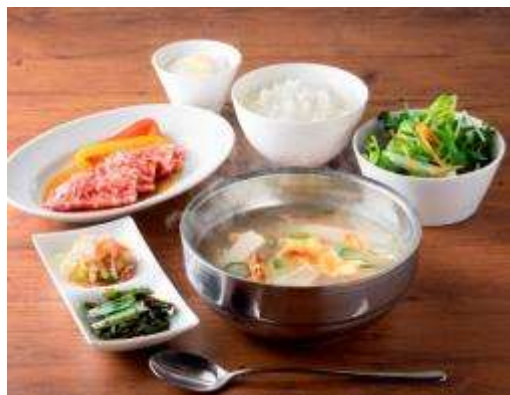
名物！干しダラのスープセット 1,580円(税抜) USHIDOKI名物の干しダラのスープと 国産カルビがセットになった美食ランチです。