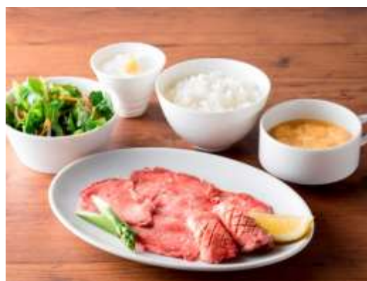
極み牛タンセット 1,680円(税抜) 厚切りタンと薄切りタンの牛タン盛り合わせ。