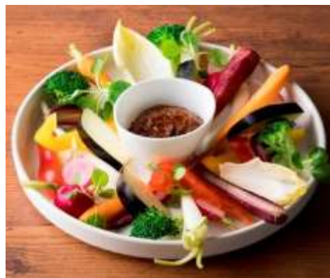
和牛肉味噌で食べる国産野菜スティック 980円(税抜) お店仕込みの和牛の肉味噌をこだわりの産地より 取り寄せた国産野菜で召し上がってください。