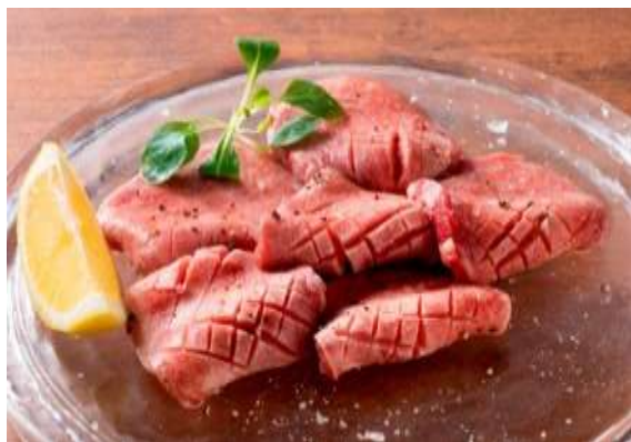
国産厚切り極み牛タン 3,000円(税抜)※入荷次第限定 超希少な国産の牛タンをチルドで入荷。 柔らかい肉質はぜひ厚切りで堪能ください。