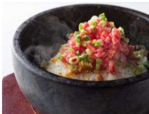
石焼き和牛ガーリックライス 1,300円(税抜) ミンチにした黒毛和牛とニンクを石焼きで香ばしく ガーリックライスにしました。