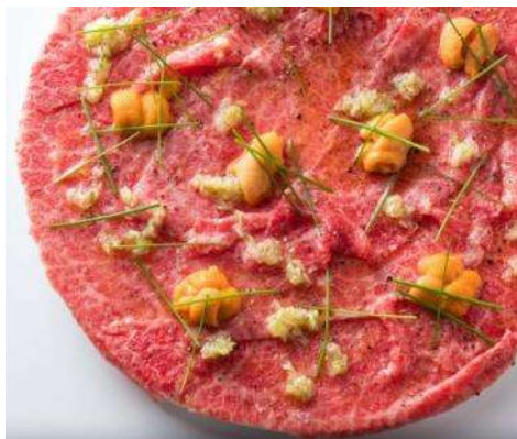
とろける和牛USHIDOKIユッケ 2,780円(税抜) とろける和牛ととろける雲丹の贅沢コラボ♪ USHIDOKIに来たら必ず食べて頂きたい商品。

牛肉は部位ごとに最高に美味しく食べられる産地・ランクにこだわり厳選した和牛を、長年焼肉店で経験を積んできた料理人の技術で食べ頃まで熟成させ、いちばん美味しく味わえるカットで提供します。 また、国産野菜にこだわった一品料理やオリジナルスープなど、体にうれしい美食が焼肉をよりいっそう引き立てます。