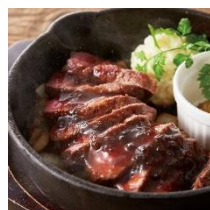
熟成大麦牛のステーキ

対象のメニューには、通常価格でもお客様から非常に人気の高い「熟成大麦牛のステーキ」や「チーズタッカルビ」に加え、ちょっと贅沢な「うに×お肉」の寿司3種類や「生ハムとローストビーフの盛り合わせ」も対象となり、非常にお得なフェアとなっております。他にも厳選した土間土間の人気肉料理と生ビールが半額でご注文でき、対象メニュー全てがワンコイン(500円)以下でお楽しみいただけます。