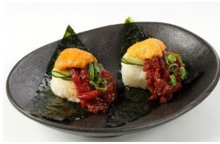
うに×さくら肉寿司※