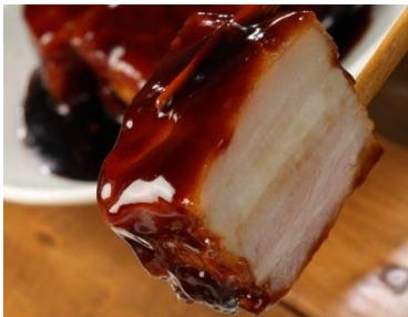
黒酢豚 ハーフ 590円 ⇒ 特別価格295円