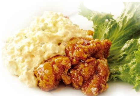
たっぷりタルタルのチキン南蛮 490円 ⇒ 特別価格245円