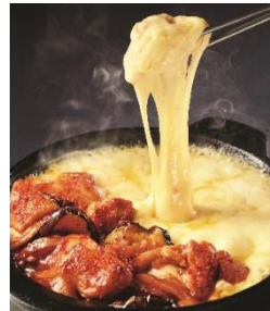
チーズタッカルビ (レギュラー・2~3人前) 790円 ⇒ 特別価格395円