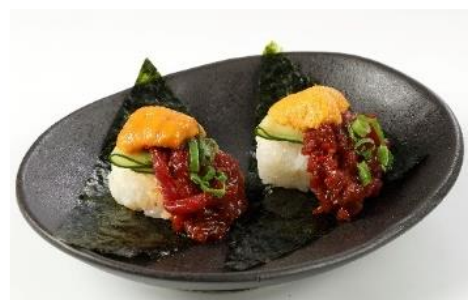
うに×さくら肉寿司(2個)※ 360円 ⇒ 特別価格180円