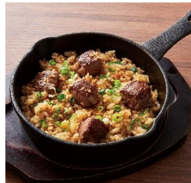
熟成大麦牛のガーリックライス※ 490円 ⇒ 特別価格245円