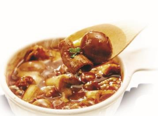
ビストロ風もつ煮込み 390円 ⇒ 特別価格195円