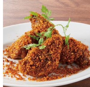
骨付き辛味チキン 550円 ⇒ 特別価格275円