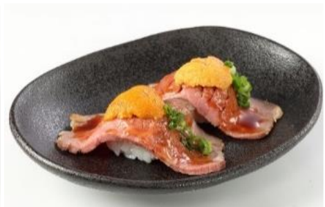
うに×ローストビーフ寿司(2個)※ 360円 ⇒ 特別価格180円