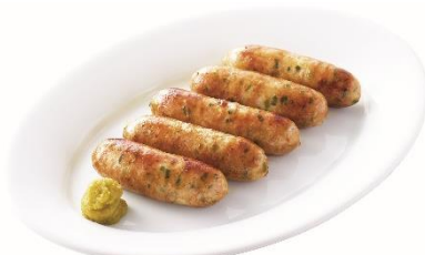
DOMA餃子ソーセージ 590円 ⇒ 特別価格295円