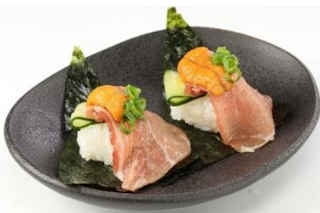
うに×生ハム寿司(2個)※ 360円 ⇒ 特別価格180円