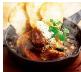
5時間煮込んだ牛ほほ肉 690円 ⇒ 特別価格345円