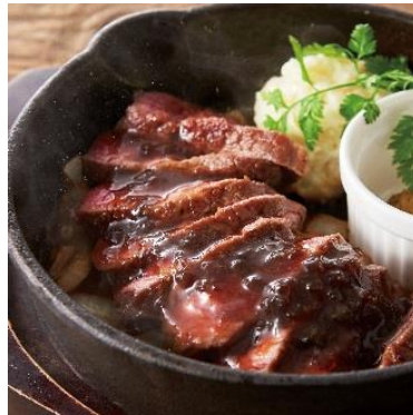
熟成大麦牛のステーキ 690円 ⇒ 特別価格345円