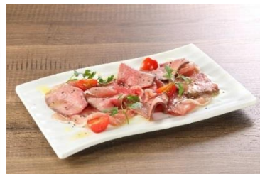
生ハムとローストビーフの盛り合わせ 590円 ⇒ 特別価格295円