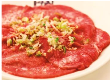
*牛タン塩は形を整える加工をしております。