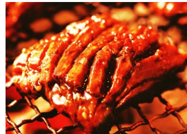
*王様ハラミはお肉をやわらかくする加工をしております。