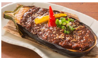
生姜肉味噌の米茄子田楽 630 円 (税抜)