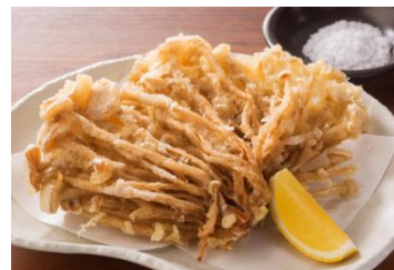
味えのき扇揚げ 480 円 (税抜)