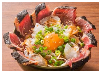
ローストカツオ丼 580 円 (税抜)