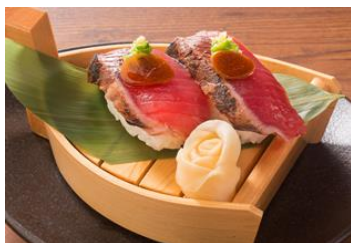
鯉のにぎり (二貫) 250 円 (税抜)