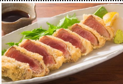
レアかつおカツ 780 円 (税抜)