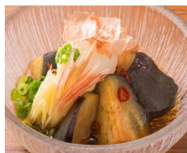
米茄子の揚げ浸し 480 円 (税抜)