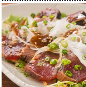
鯉の土佐造り 680 円 (税抜)