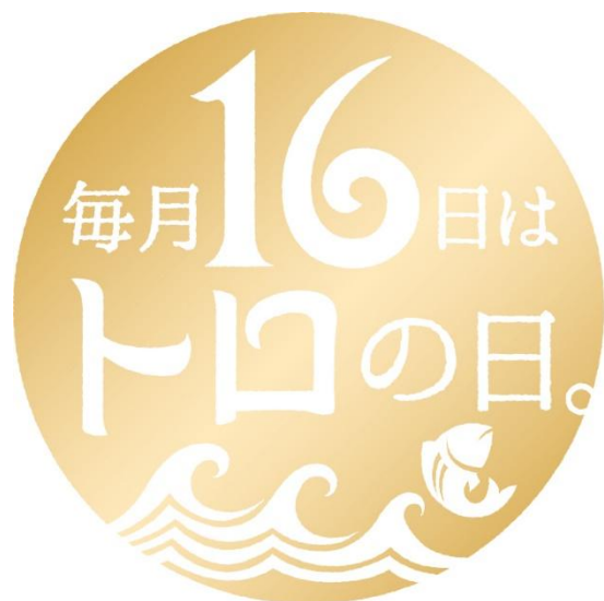
<トロの日ロゴマーク>