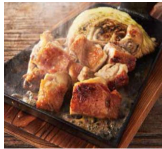
氷温熟成 鶏もものくわ焼き 岩塩焼き 890円(税抜)