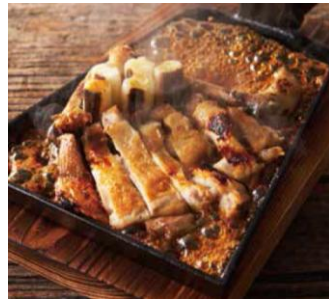
氷温熟成 鶏もものくわ焼き すき焼き 890円(税抜)