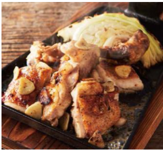
氷温熟成 鶏もものくわ焼き にんにく焼き 890円(税抜)