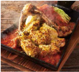
氷温熟成 鶏もものくわ焼き トマトチーズ焼き 890円(税抜)