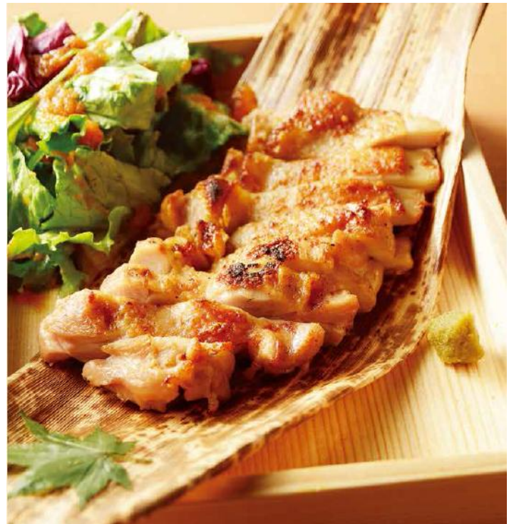
氷温熟成 鶏ももの一枚焼き 890円(税抜)