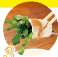
3 さらにお肉で巻いて