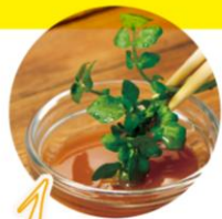
1 まずはそのまま梅ディップ