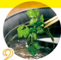
2 梅だしでしゃぶしゃぶ