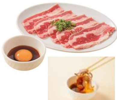
・月見カルビ 580円（税別）

今後も旬の新鮮な素材を提供することで、お客様にご利用いただける機会の増加を目指します。