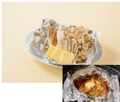
・キノコのホイル包み 味噌バター味 480円（税別）