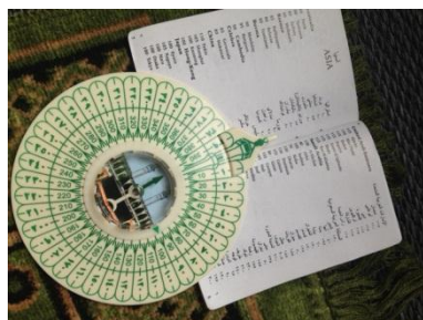
メッカの方角を知るためのコンパス

～ムスリムは一日に5回、メッカの方角に向かって祈りを捧げることが習慣となっています～