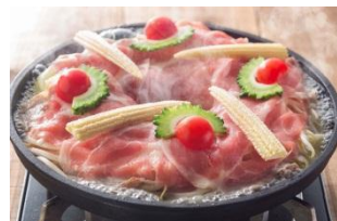
【熟成四元豚の 八海山鉄板蒸し焼き】 980円（税抜）

爽やかな香りとまろやかな酸味が特徴の酢橘（すだち）にはビタミンCがたっぷり。 美味しさもより一層引き立てます。