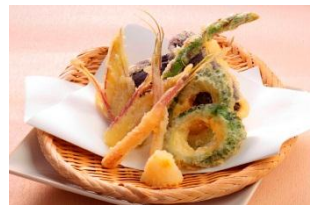
【夏野菜の天ぷら】 680円（税抜）

夏野菜を様々なお料理で、旬魚はお造りに。 季節のそばは辛味大根おろしを添えてご提供いたします。