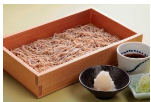
【辛味大根おろし蕎麦】 780円（税抜）