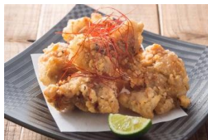
【旨味塩の唐揚げを スタヂでさっぱりと】 580円（税抜）