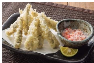
【宮崎産めひかり天ぷら 海老塩スタヂ】 680円（税抜）