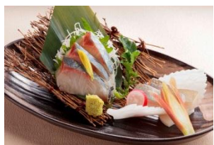
【縞あじの造り】 780円（税抜）