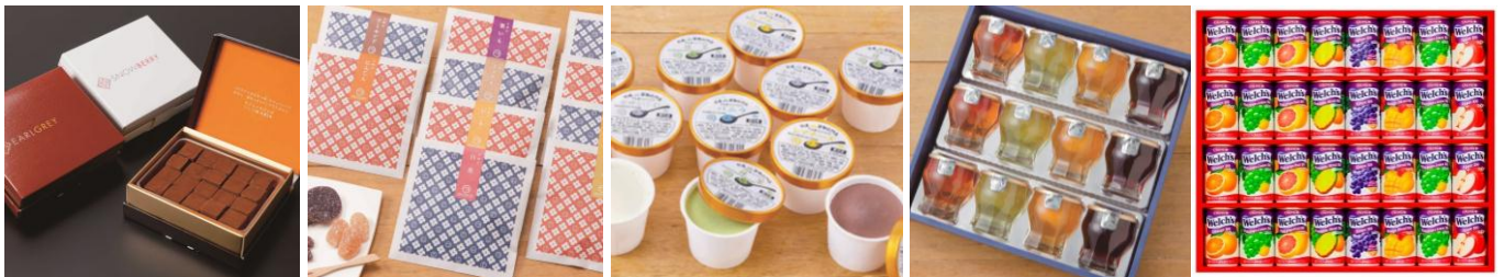
【シルスマリア生チョコレート詰合せ】 一セット 4,500円（税・送料込） 公園通りの石畳20粒、スノーベリー20粒、アールグレイ20粒 各1箱