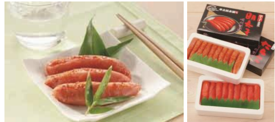
【博多明太子&たらこセット900g】 一セット 5,000円（税・送料込） 辛子明太子400g、たらこ（切り）500g