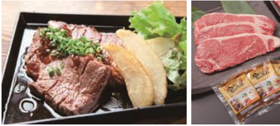
【USアンガスビーフサーロインステーキ】 一箱 5,000円（税・送料込） 約180g×3枚+宮のたれ小袋×3袋