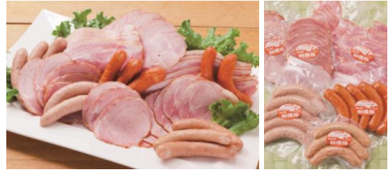
【相模豚ハム・ウィンナーセット】 一箱 5,000円（税・送料込） ベーコンスライス250g、ロースハム・モモハム各100g、 チョリソー5本、しそ入りウィンナー5本、ガーリックウィンナー3本