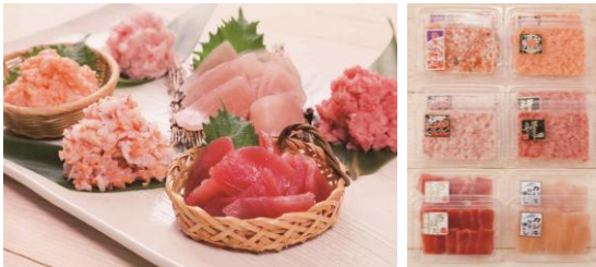
【工場直送 海鮮詰め合わせ6種セット】 一箱 5,000円（税・送料込） ネギトロ、サーモンネギトロ、キハダ切身し中落ち風 海鮮宝石箱、ピンチョウマグロたたき、マカジキ切り落とし