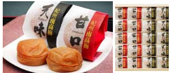
【紀州南高梅 二梅（にばい）20粒】 一箱 5,000円（税・送料込） 甘口はちみつ10粒、つす塩味天味10粒