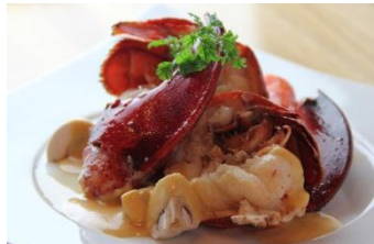
【オマール海老のポワレ ヴァンプランソース】 1,800円