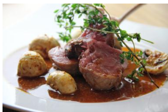
【乳飲み仔牛の骨付きロースト エルブの香り】 1,680円